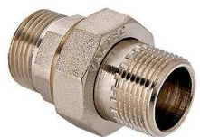
VTr.728 Сгон разъемный Н-Н (американка)