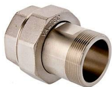
VTr.341 Сгон разъемный В-Н (американка)