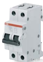
SK 033 B 02