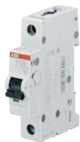
SK 018 B 01