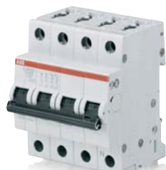
SK 029 B 02