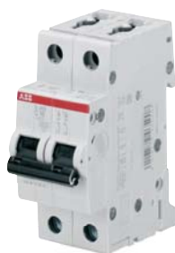
SK 019 B 01