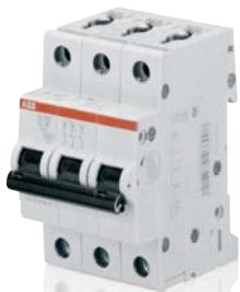
SK 020 B 01