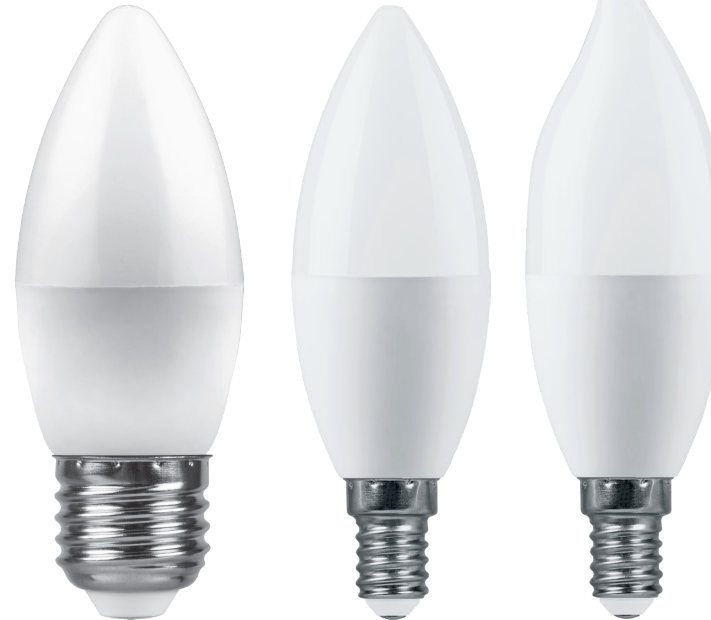
Арт. 38110, 38111, 38112