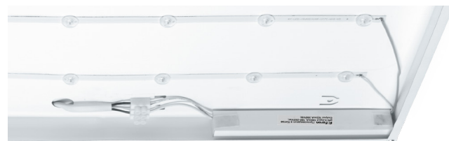
Расположение драйвера вне зоны видимости

AL2117 ТМ FERON – универсальная светодиодная панель с равномерным свечением.