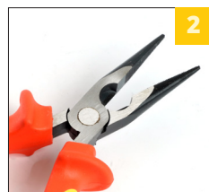
2 режущая кромка HRC 52