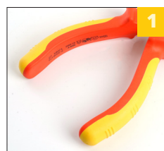
1 двухкомпонентная рукоятка