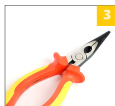
3 высокопрочная хром – ванадиевая сталь