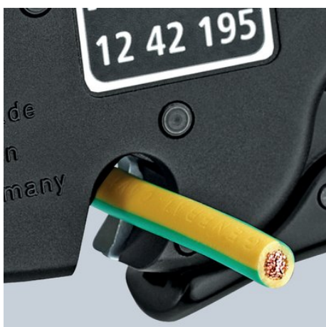
Резак для многожильного кабеля сечением до 10 мм 2