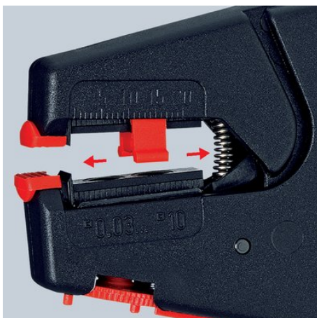
Передвижной ограничитель длины