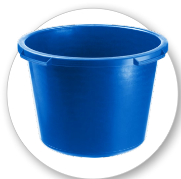
Первичный высокопрочный пластик