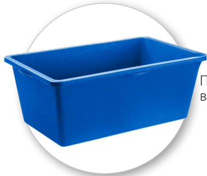
Первичный высокопрочный пластик