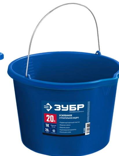
Тазы строительные усиленные круглые