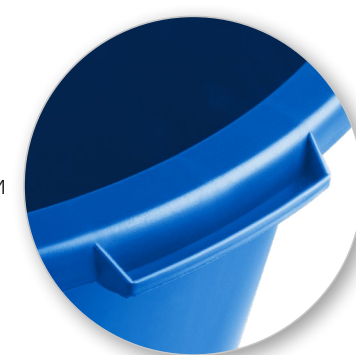
Ручки для переноски