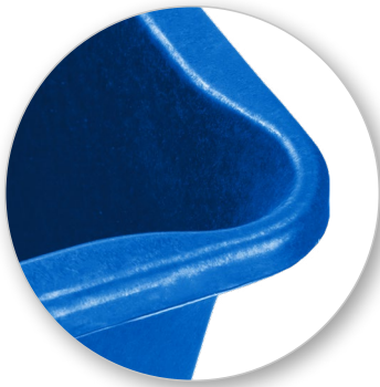
Носик для слива